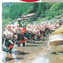
豊作を願う阿新地区伝統行事 “お田植祭”