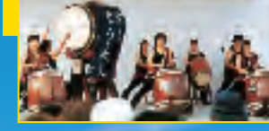
ソーラン節 (有漢中学校)